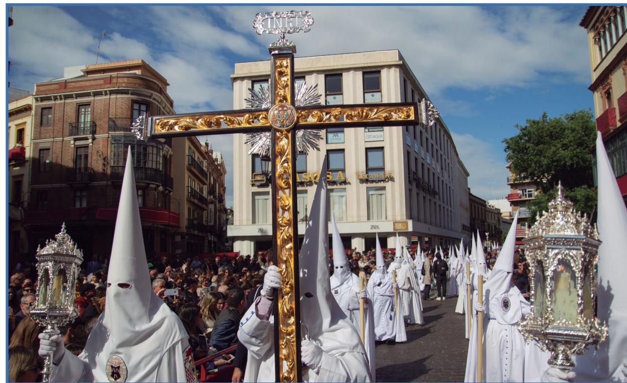
● La cruz de guía y los primeros

Con la resaca de lo ocurrido y el aprendizaje logrado, afron-