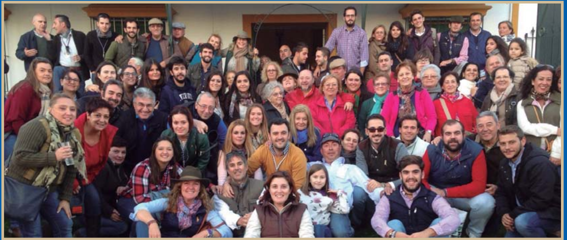
● Más de un centenar de hermanos participaron este año en la tradicional Peregrinación al Rocío.