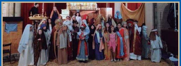
● Éxito de participación en el Belén Viviente organizado por nuestro Grupo Joven con los niños del Grupo Infantil.