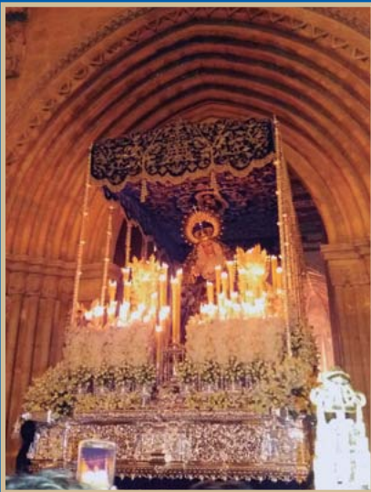
● El 24 de octubre recibimos a la Virgen de la Hiniesta en Santa Marina.