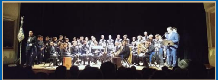
● La Sala Joaquín Turina acogió la tercera edición del certamen de villancicos 'Resucitando la Navidad'.