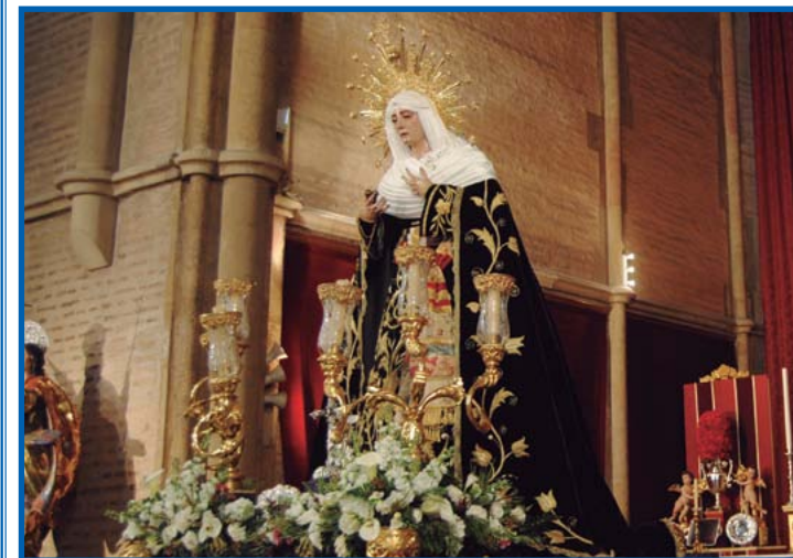
● La Virgen del Amor en el Viacrucis del pasado año.

Mayordomía antes del 31 de mayo de 2016, sin que a su entrega sea devuelta ninguna parte de la cantidad del alquiler. Asimismo, se informa que las túnicas podrán ser adquiridas en propiedad por el precio de 50 €. En esta cantidad se incluye la capa, túnica, antifaz, los dos escudos, el cíngulo, los botones y los cordoncillos. De igual modo, todos aquellos hermanos que no hagan uso de alguna de estas túnicas pero que deseen adquirirlas de igual modo pueden ponerse en contacto con los mayordomos quienes le facilitarán toda la información necesaria sobre este asunto. Rogamos también que aquellos hermanos que posean túnica de la hermandad en sus casas y no vayan a utilizarlas este año procedan a devolverlas a la mayor brevedad posible. ●