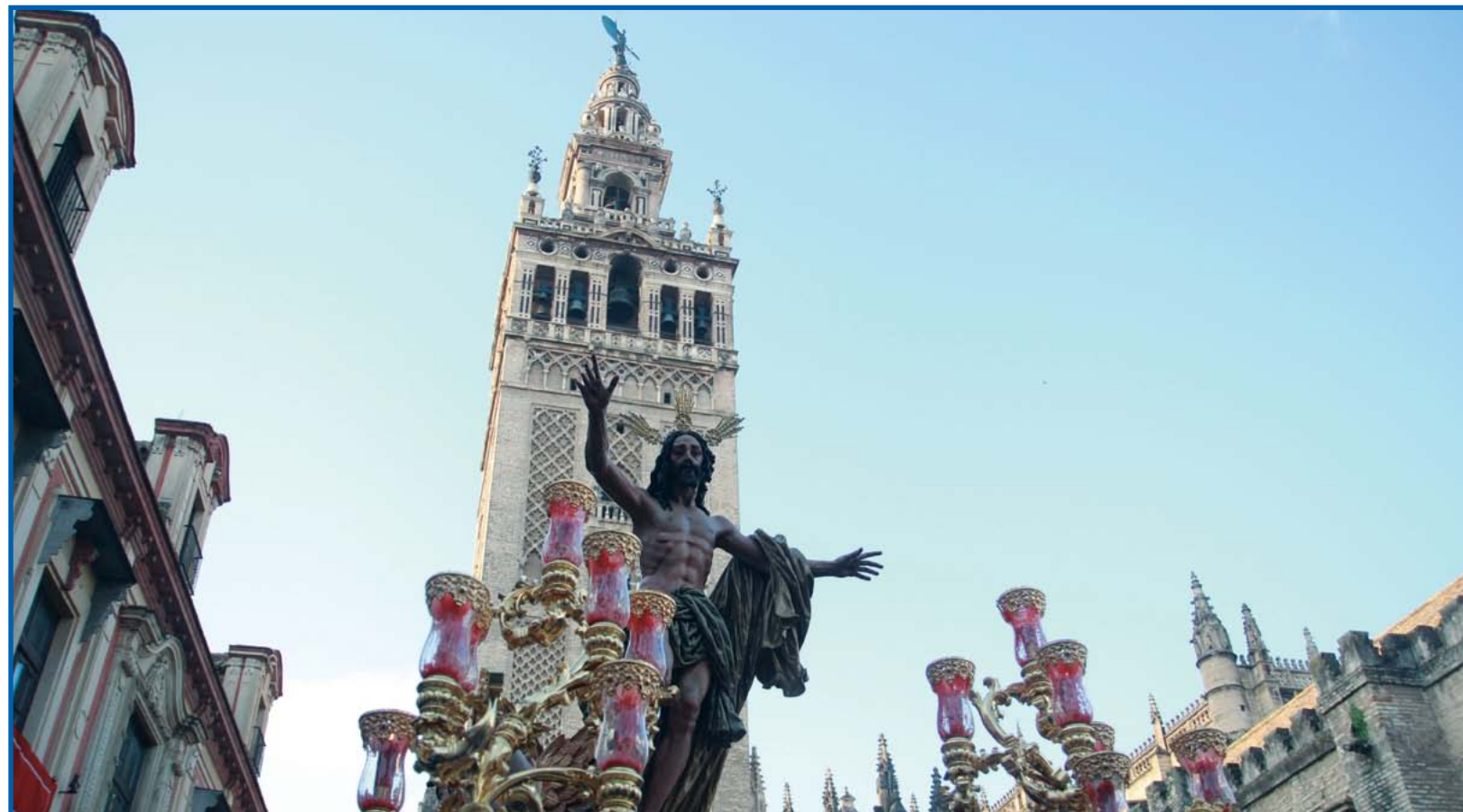
● El Señor de la Sagrada Resu-

Con vista a la estación de penitencia espero que este año 2016 sea al menos igual que el