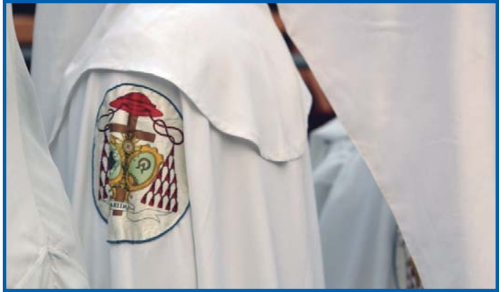
● Nazarenos de la Resurrección en la estación de penitencia.