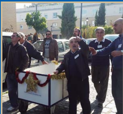
● Casi una tonelada de alimentos recogimos en la Operación Carretilla.